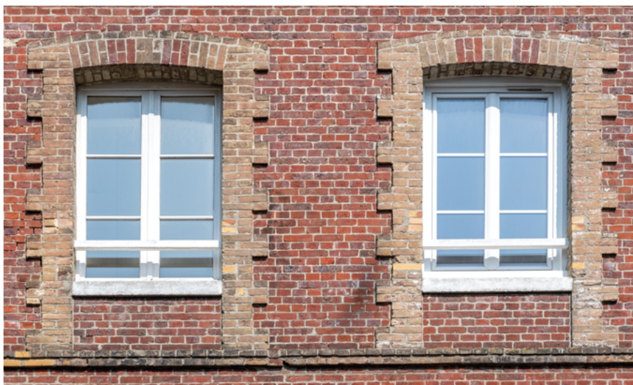
Acquisition #6 - 44, rue Guerrier 76200 Dieppe