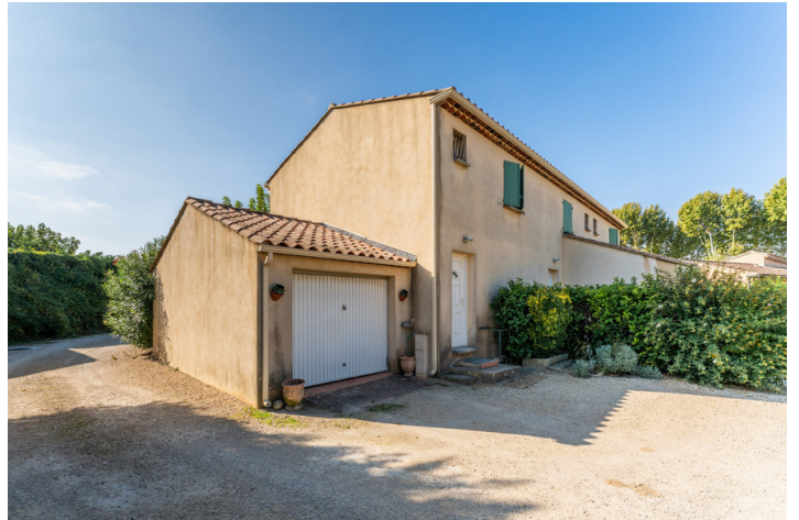
#30 - Chemin de la Genestière Sénas 13560