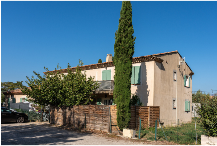
#29 - 45 Impasse des Bouvreuils Mallemort 13370