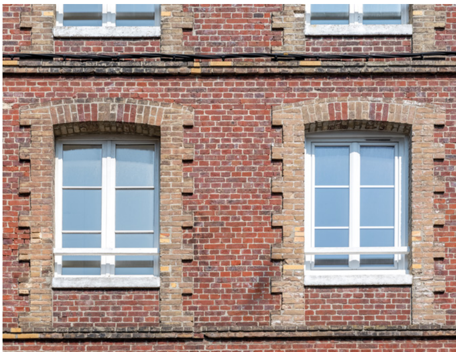
Acquisition #6 - 44, rue Guerrier 76200 Dieppe